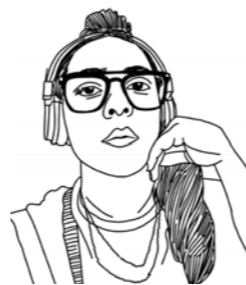
Zeichnung: Andrea Wong / @andrewong_illustration

ist Kulturwissenschaftlerin, Performerin und Bildungsreferentin. Sie performt, forscht und lehrt an Schnittstellen künstlerischer, politischer und wissenschaftlicher Diskurse zu Dominanzverhältnissen, machtkritischen Perspektiven und widerständigen Handlung(ssstrategien). Ihre Theorie und Praxis fußen im Queer-Feminismus, (Anti-)Rassismus, Postkolonialismus und Empowerment. Sie berät und schult Einrichtungen bei der Umsetzung nachhaltiger anti-semitismus- und rassismuskritischer Bildungs-, Kunst- und Kulturarbeit. Ich möchte das Wahlrecht verändern in ein Wahlrecht für alle in Deutschland lebenden Menschen, unabhängig vom Pass. Ich möchte die Curricula von Bildungsinstitutionen verändern, sodass ihre Lehre auf menschenrechtsorientierten berufsethischen Prinzipien fußt. Ich möchte Theaterinstitutionen so verändern, dass eine Anti-Diskriminierungsklausel selbstverständlich in allen Arbeitsverträgen implementiert wird.